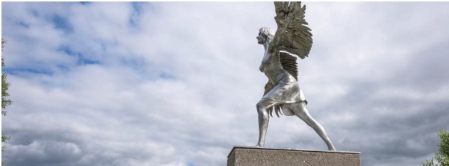
Die „Vogelfrau“ aus der Arbeit „Geister des Emschertals“ vom britisch-argentinischen Künstlerduo Lucy und Jorge Orta.

Im Emschertal. 24 Werke, verteilt auf 50 Flusskilometer: Die Emscherkunst feiert alle drei Jahre die Rückverwandlung der einstigen Abwasserkloake des Reviers in einen Fluss.